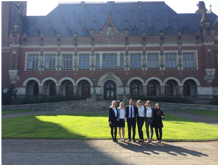
PCA PreMoot Den Haag