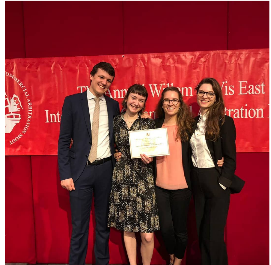
Preisverleihung in Hongkong